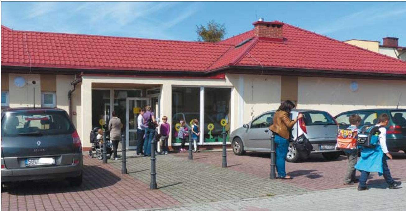
W Imielinie powstała jeszcze jedna placówka oświatowa, dzięki czemu wszystkie dzieci znalazły miejsce w przedszkolu.

74 dzieci 5 i 6-letnich uczęszcza do przedszkola przy ul. Dobrej. Poprzednio mieścił się tu komisariat policji. Kosztem ponad 375 tys. zł obiekt został przebudowany na cele oświatowe.