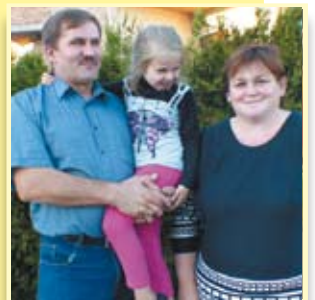
Medal dla rolnika