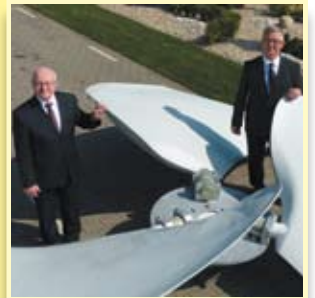
20 lat Wentechu