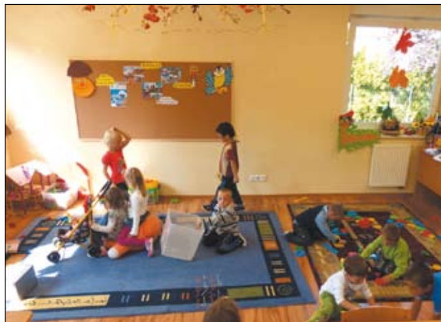
Dawny komisariat policji stał się miejscem przyjaznym dzieciom, w którym chętnie spędzają czas.

Oprócz ciągłego odsuwania w czasie obowiązku szkolnego 6-latków, pojawił się w