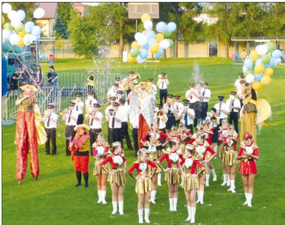
Widowiskowy pokaz na boisku z udziałem mażoretek, orkiestry i szczudlarzy.

Dla dzieci przygotowano park zabaw z gamą dmuchańców, rozdawane były krówki, w których kto miał szczęście mógł znaleźć bon na gadzety imielińskie. Nie zabrakło atrakcji również dla starszych. Jedni przyszli na Dni Imielina dla wrażeń sportowych czyli dla biegu crossowego, inni by zobaczyć kabaret, jeszcze inni by dzieci mogły się pobawić, a koljeni po prostu ze znajomymi na spacer, na grilla, na lody. Można było w bezpieczny sposób sprawdzić, jak czuje się kierowca, gdy samochód dachuje. Można było się nasłuchać, napatrzeć ale też – gdy sił zabrakło – posilić się na stoisku z kiełbaskami czy innymi pysznościami z grilla. Dzieciaki miały swoje słodkości, wśród których królowały wata cukrowa i lody.