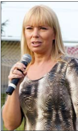
Sprawdziły się życzenia dobrej pogody, które przekazała minister Elżbieta Bieńkowska.

N a XX cross ekologiczny i XV Dni Imielina dopisała pogoda i widzowie. Odwiedzający 6 i 7 lipca stadion przy ul. Hallera mieli w czym wybierać. Od koncertu orkiestry dętej z pokazami mażorettek i kuglarzy, czy strażaków po rewię hollywoodzką, kabaret oraz różne rodzaje muzyki. Po raz pierwszy zwycięzcom głównego biegu oprócz władz miasta gratulowała również Elżbieta Bieńkowska, minister Rozwoju Regionalnego i senator RP.