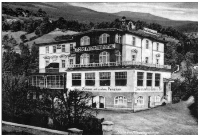
Dawny „Wilhelmsöhne” w Przesiece, a po wojnie po prostu „Związkowiec”.

W Katowicach trudno było wejść do pociągu relacji Kraków - Jelenia Góra przez Kłodzko i Wałbrzych, tak bardzo był przepełniony. Na skierowaniu pisało wyraźnie jak dojechać. Mój dom wczasowy nazywał się bardzo romantycznie: „Związkowiec”. Składał się z dwóch budynków, pierwszym był stojący przy drodze dom wczasowy „Mimoza”.