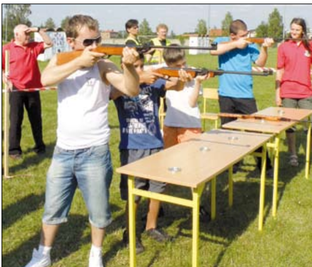
Uczestnicy zawodów strzeleckich.