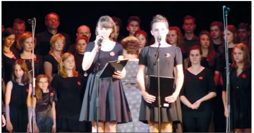
26 czerwca w Sokolni odbył się koncert promujący płytę „Oh Happy Day”.