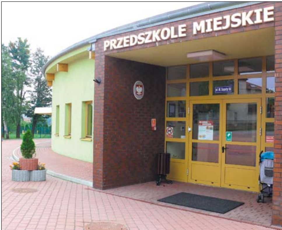
Miasto wyłożyło z własnego budżetu 5,8 mln zł na budowę przedszkola. Teraz otrzyma z funduszy europejskich zwrot 85% z tej kwoty, czyli niemal 5 mln zł. Może je przeznaczyć na dowolny cel służący mieszkańcom.

Okazało się jednak, że wiele gmin, które dostały dofinansowanie w konkursie nie przygotowało na czas projektów, nie miało pozwoleń na budowę. Ponadto na niektórych inwestycjach udało się zaoszczędzić, gdyż ceny po przetargach były niższe od kosztorysowych, stąd i dofinansowanie unijne było niższe. Dlatego wniosek Imielina piął się systematycznie w górę na liście – najpierw z 14 na 8 miejsce, potem na 4. Wreszcie organizator konkursu poinformował miasto, że jego wniosek otrzyma dofinansowanie, o które się starał, czyli 85 % poniesionych kosztów budowy (85 % z 5,8 mln zł to