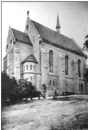
Tak wyglądał kościół przed wojną.

Komitet budowy kościoła w Imielinie został powołany niemal równo 110 lat temu, bo 1 października 1902 r. Zaledwie 3 tygodnie później otrzymano pozwolenie na budowę od władz kościelnych, natomiast ponad półtora roku trzeba było czekać na takowe od władz państwa niemieckiego. Powstał projekt kościoła. Gdyby jednak według niego wybudowano świątynię, byłaby większa od chełmskiej, której miał być filią, na co w Chełmie nie chciano się zgodzić. Zaprojektowano go zatem na nowo.