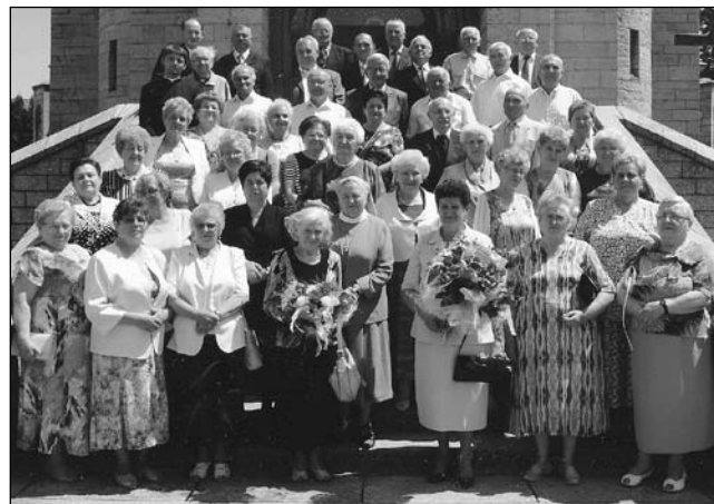
Powyżej uczestnicy tegorocznego spotkania, poniżej zdjęcie z 1992 r.