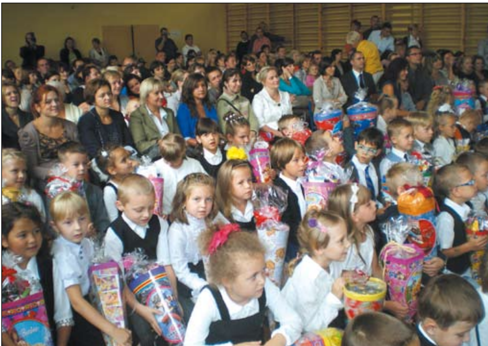
3 września w szkole podstawowej.

3 września rok szkolny 2012/2013 rozpoczęło w imielińskich placówkach oświatowych niemal ośmiuset uczniów.