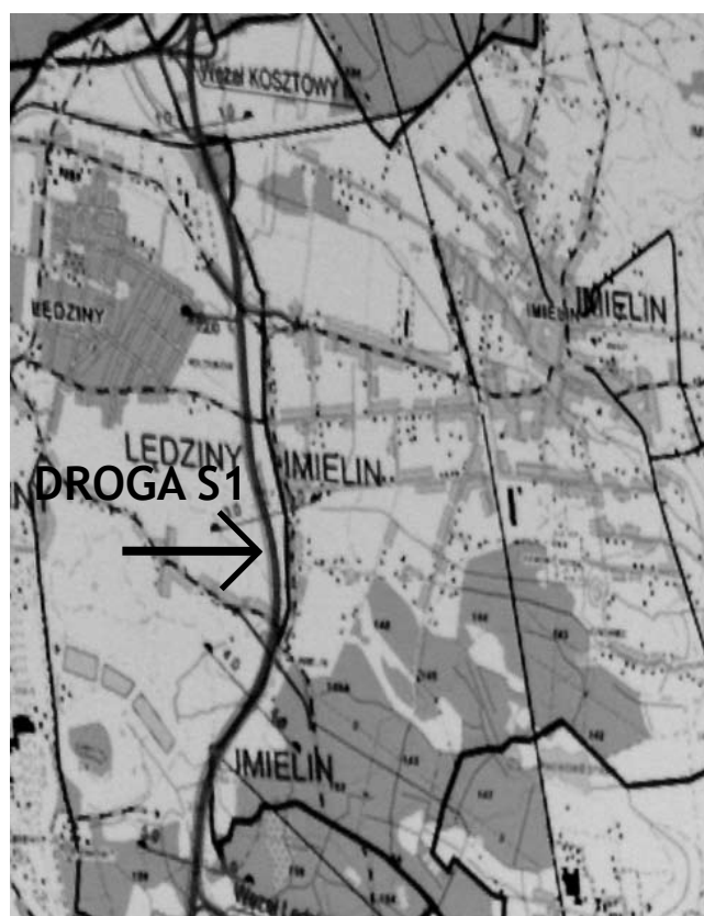
W Imielinie zamiast 4 wariantów jest 1.

Optymistycznie etap przygotowawczy inwestycji potrwa 2 - 3 lata, a sama budowa również 2