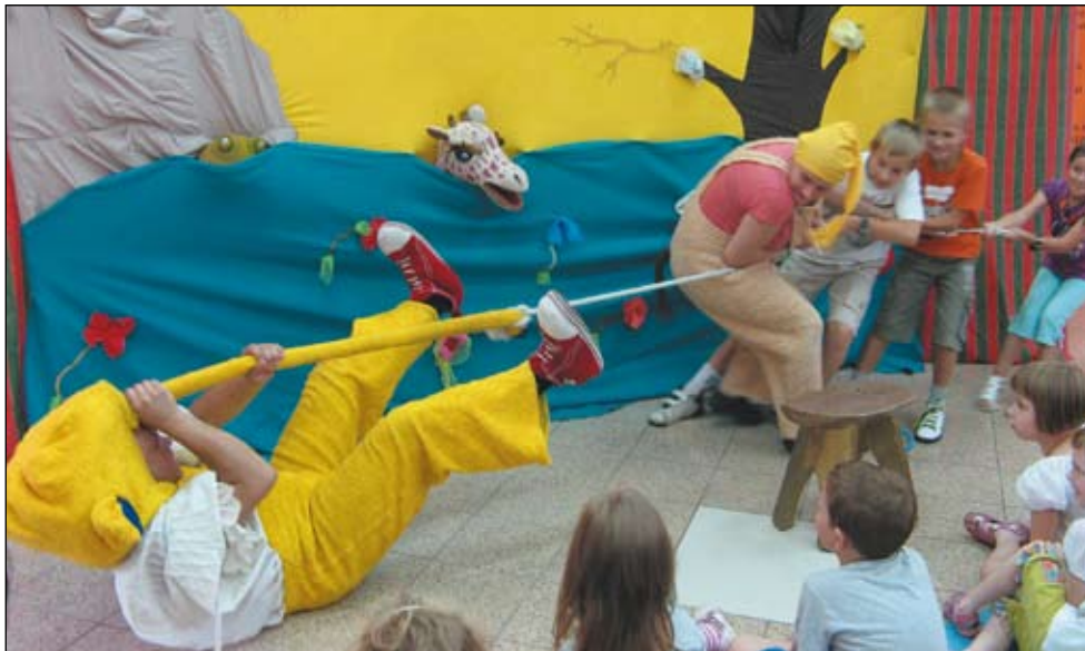
Powyżej: teatralne zabawy w bibliotece. Poniżej: sportowe półkolonie; na dole: zajęcia w Sokolni.

Uczestnicy korzystali z różnych technik – malowania przy pomocy pędzli, wałków, stemplowania ziemniakami; dzieci wycinały, kleiły, podwieszały na linkach, tworzyły przestrzenne instalacje z pa-