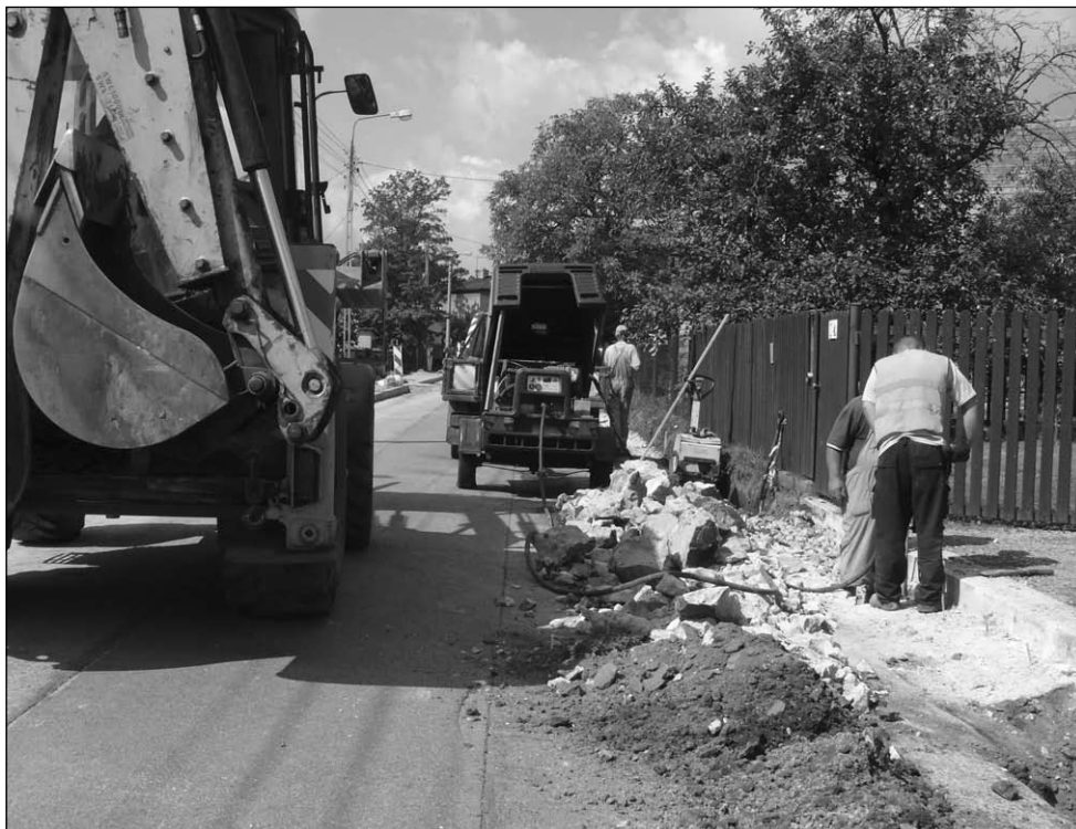
Trwają prace przy budowie chodnika na ul. Poniatowskiego.

niach dla dziewcząt i zielone oraz szare w sanitariatach dla chłopców. Do zamontowania pozostały jeszcze kabiny, które będą wykonane z laminowanych i wodoodpornych płyt. Trzeba będzie również pomalować pomieszczenia. Prace te wykonuje za 84,7 tys. zł Zakład Remontowo-Budowlany Jerzego Kotlarza z Sosnowca. To jedna z 3 firm, które stanęły do przetargu.