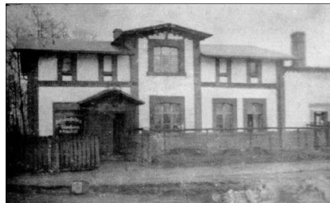
Dom dawnej piekarni Matuszczyków na „Pidle”.

Już od ponad stu lat nie ma tam też pidła, ale o oko-