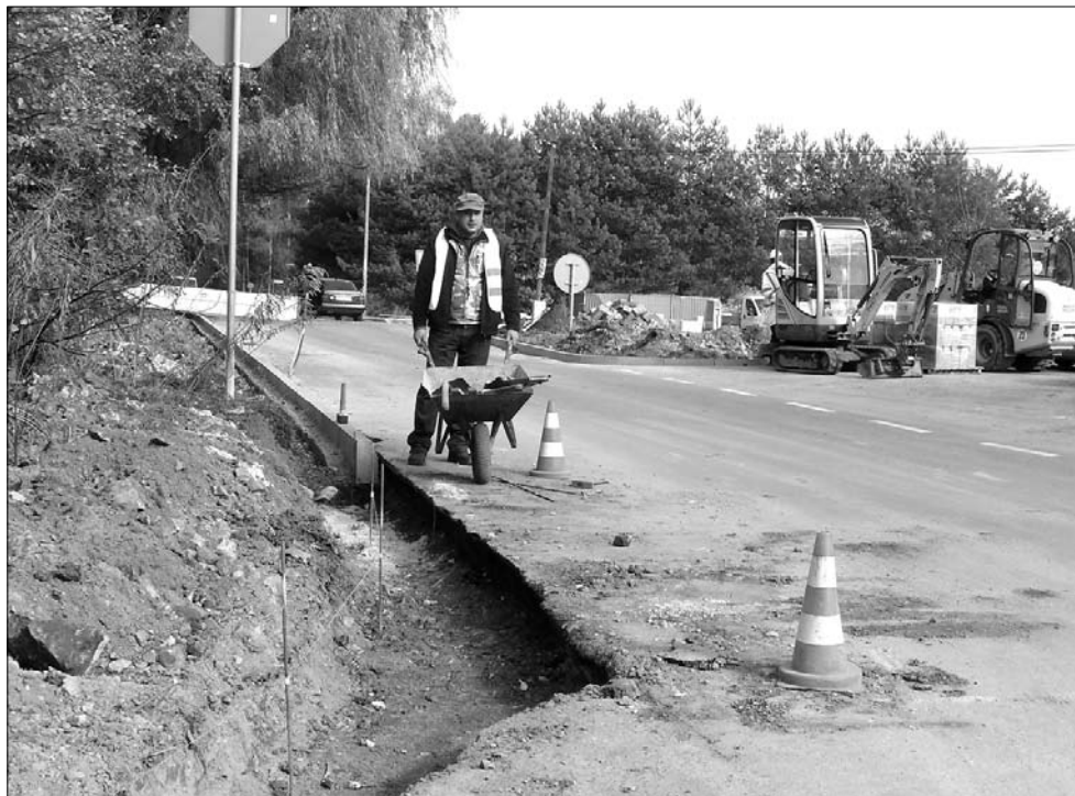
Na początku października rozpoczęły się prace na ponad półkilometrowym odcinku ul. Satelickiej.